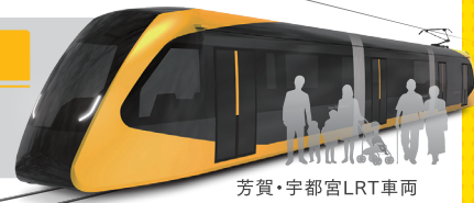
芳賀・宇都宮LRT車両

日頃より、宇都宮市の交通行政にご理解とご協力をいただき御礼申し上げます。 さて、LRT整備につきましては、2018年(平成30年)6月より順次、工事を進めているところであり、今回、下記の工事を実施いたします。 工事期間中、皆様にはご不便、ご迷惑をお掛けしますが、ご理解とご協力を賜りますよう、お願い申し上げます。