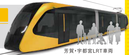
芳賀・宇都宮LRT車両