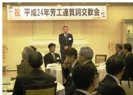
祝辞を述べる豊田町長