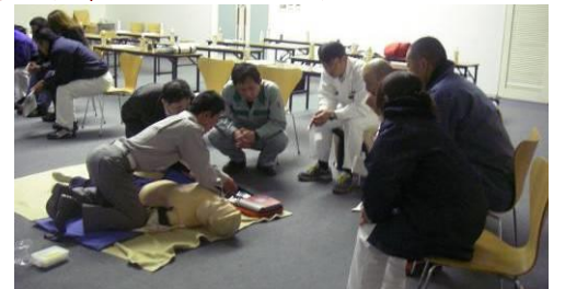
AEDの説明を熱心に聞く