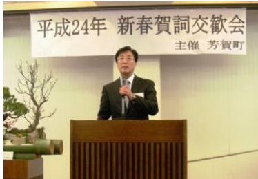
河合会長の乾杯の発声

町長は、あいさつの中で平成 24 年度に取り組む三つの重点施策を 紹介しました。