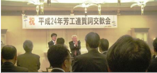
町と芳工連一体の三本締め

乾杯ののち、祝宴が始まりましたが、各自席を離れて 思い思いの人に新年の挨拶や、名刺を取り交わしておりました。また、本年は、震災後初めての賀詞交歓会でしたので、賀詞交歓会が開催出来る喜びや、震災の体験談にも花が咲きました。お酒を酌み交わし、人の寄るところに大きな輪が広がります。お陰様で、賀詞交歓会で新たな取引が始まった方もいるそうで、人の繋がりを楽しみに参加している方もいます。