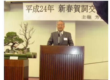
豊田町長のご挨拶