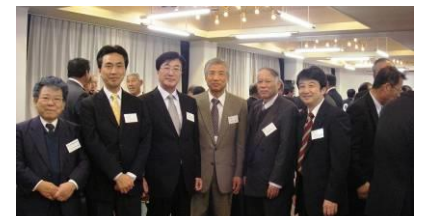
参加した芳工連会員