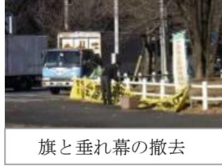
旗と垂れ幕の撤去

交通安全活動は、精神的にも忙しい年末に実施いたしましたが、交通安全ののぼり旗は、部会員が揃う、1月6日に撤去と整備を行いました。