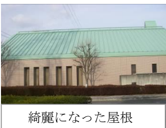
綺麗になった屋根

昨年の11月から管理センターの屋根の塗装塗り替え工事を実施してきましたが、この度、終了しました。