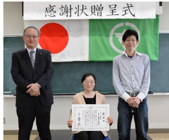
ジェーピーエス製薬(株) 様