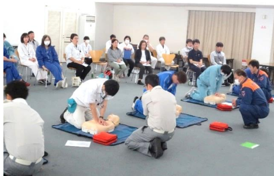
<心肺蘇生(胸骨圧迫)>

安全衛生部会主催の普通救命講習会(第1回)を6月21日(金)管理センターで、29名の皆様に受講していただきました。最初にDVD視聴により一次救命処置(心肺蘇生とAEDの使用)の流れを学んだ後、5グループに分かれ、グループごとに一人ひとりが心肺蘇生(胸骨圧迫+人工呼吸)、AEDの使用を訓練用マネキンを使って実践しながらに訓練しました。また、気道異物の除去や止血法につ