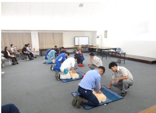
<心肺蘇生(胸骨圧迫)>

忙しい中、真岡消防署芳賀分署の皆様にご指導いただき感謝申し上げます。なお、受講されていない方は、次回以降の講習会(②7/26、③10/9、④12/3)に参加されますようお願いいたします。