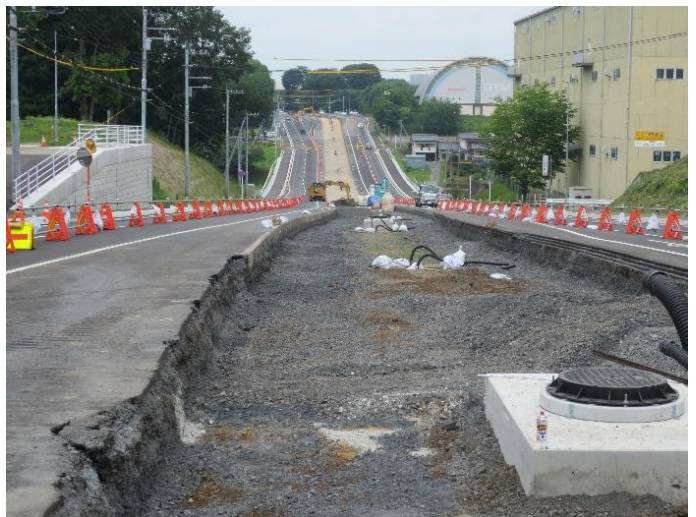
<進む LRT 軌道工事>