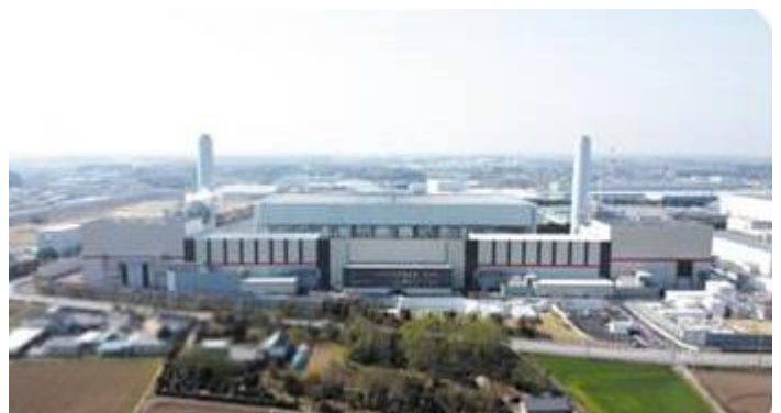
<コベルコパワー真岡>

協議事項では、普通救命講習会は昨年同様の開催方法となり第1回を7月12日(火)に開催することで決定しました(2回目以降は9月13日(火)、10月26日(水)、12月6日(火)の予定です)。安全活動事例発表会・安全衛生講習会は10月28日(金)に開催し、東洋濾紙(株)様が事例発表を行います。優良企業視察研修会は8月30日(火)に(株)コベルコパワー真岡(真岡発電所みらいん)を訪問、また健康づくり講習