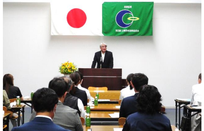
<種子副会長開会挨拶>