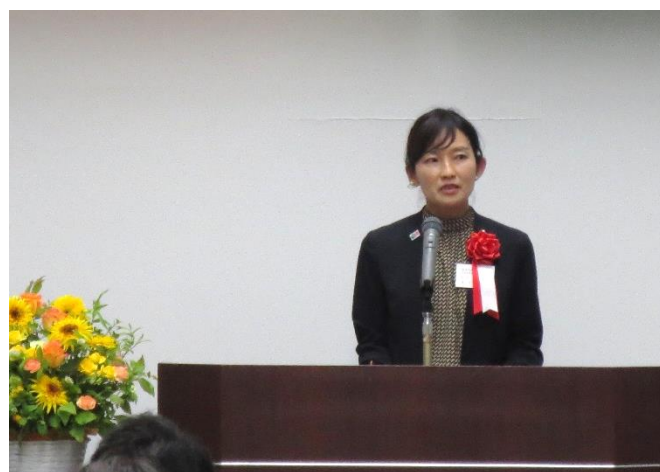
<過足企業立地班長祝辞>