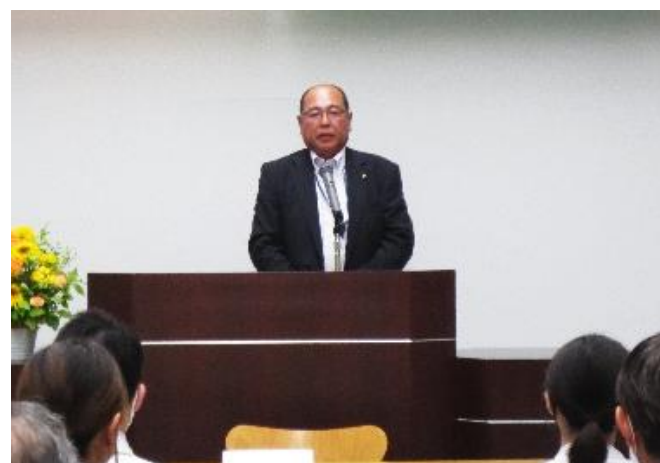
<多部田副会長閉会挨拶>