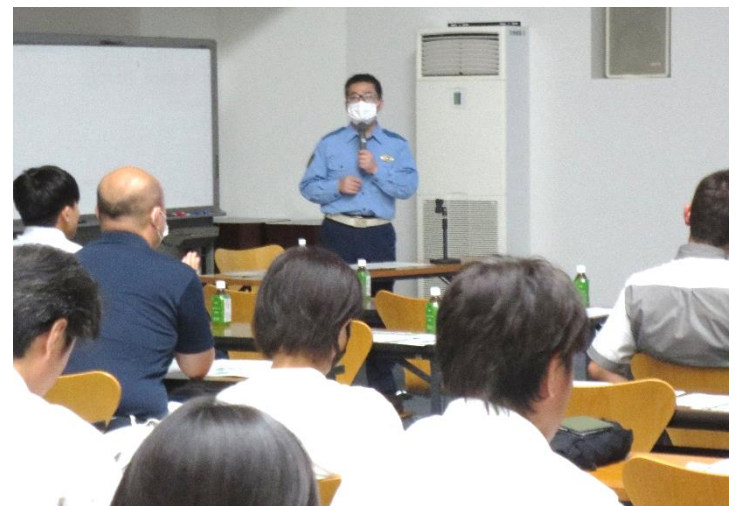
(岡畑交通総務係長講話)