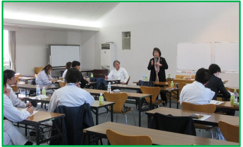
【女性活躍推進委員会の呼びかけで 集まったフードバンク様子】

ハラスメントについては、具体例の他に相手へのリスペクト(尊敬や敬意)を持って声掛けやコミュニケーションを行う大切さについて、学んでいただきました。