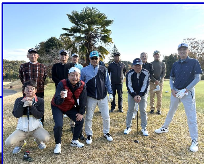
【快晴のゴルフ大会】